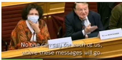
Nobel Price winner Prof Luc Montagnier speaks at the Luxembourg Parliament on covid vaccine danger

Úrslitið er, at omanfyri 76% av froyingum nú hava eitt øðrvísi DNA, "uppskrift uppá lívið", enn støðan var áðrenn koppingarherðferðina. Óhefta vísindin hefur staðfest, at Spike proteinið endar í kyknukjarnuni, har tað gerst partur av DNA stronginum, og m.a. sýnist vera til ampa fyri lívsneyðugu rættingunum av DNA stronginum, sum tørvur er á, støðugt!