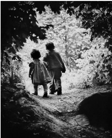
W. Eugene Smith, myndatíðindamaður (1918-1978)

W. Eugene Smith var evnaríkur og samkenslufullur myndatíðindamaður, sum legði størsta dentin á at lýsa viðurskifti, sum góvu honum trega, so sum kríggj, fátakradømi, órættvísi, líðingar og manglandi heilsurøkt.